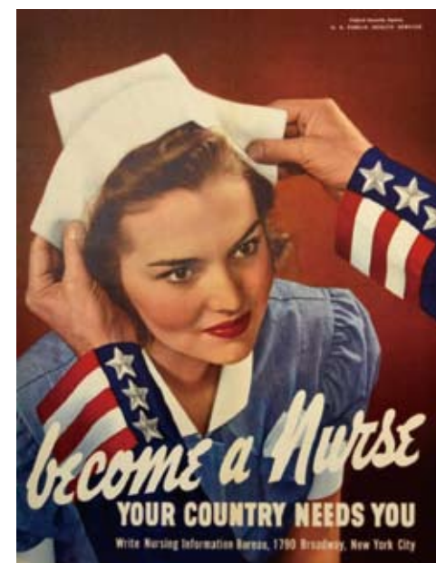
图12:欢迎加入护士队伍,你的祖国需要你!

海报又译成招贴画[poster],是一种重要的视觉传达艺术,在其伴随历史发展的过程中,形成了丰富的视觉语言和表现形式,往往个性鲜明而且具备独特的风格,起到独特的视觉宣传功能。设计师们结合战争的特殊需求,配合不同的文化背景,通过开拓的思想和个性化的创意以及独特的艺术手段,很好地解决了战争信息的传递。