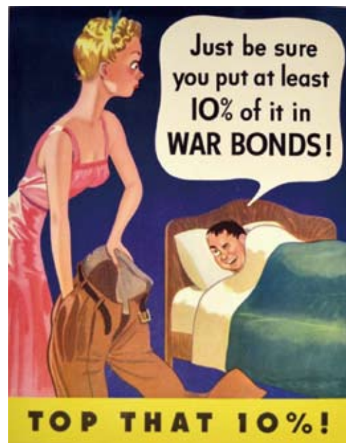
图9:要确信花10%买战争代理券。