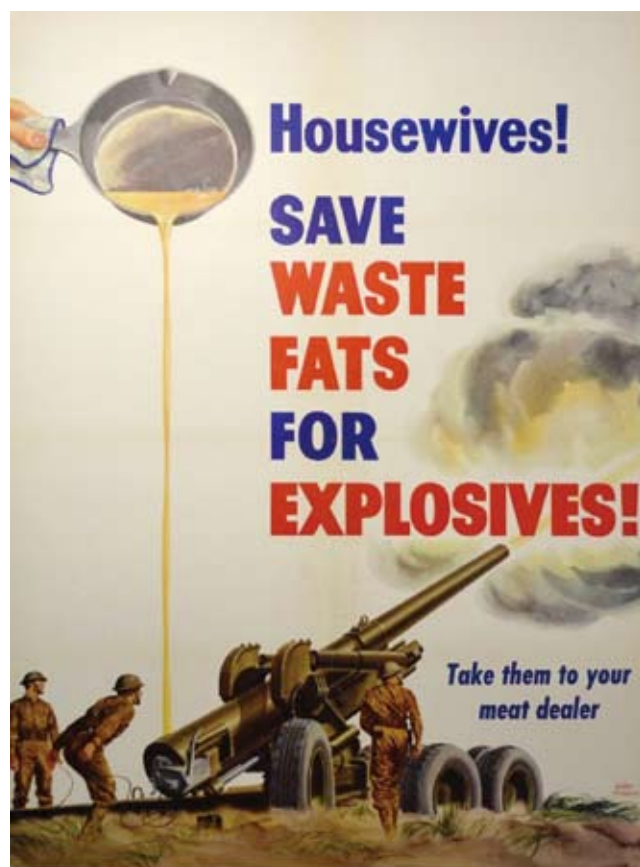
图2：节约食用油，支持造炸弹。