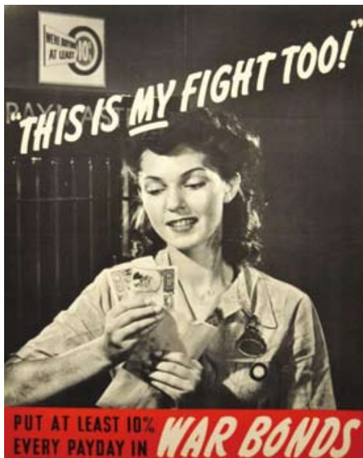
花10%薪资来购买战争债券。——这也是我的战役！