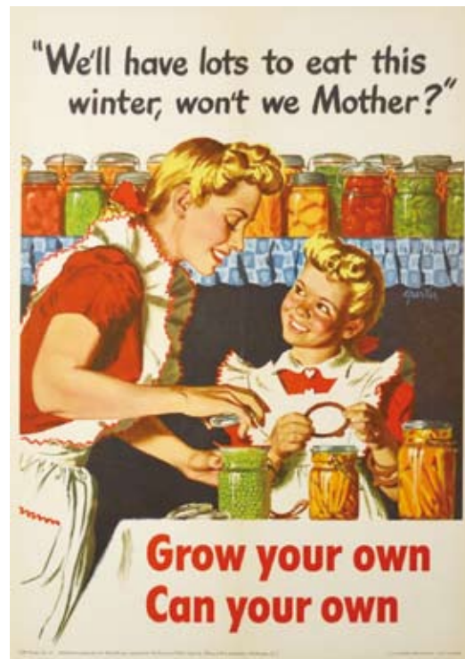
图7:自己动手,丰衣足食。

地丰衣足食,为国家减轻负担。(图7)动员老百姓购买战争代理券。(图8)其中有一幅画很有意思:有一位女士在掏男士钱包的时候,躺在床上的男士还不忘叮嘱一句:“拿了钱,不要忘记购买战争代理券。”(图9)也可看出战争经费缺乏时的全民动员。有几幅也很感人:如(图10)一个失去丈夫的妻子和孩子,画外音:我贡献出了一个男人,你可以购买战争代理券吗?让人怦然心动。这种全民的动员还体现在大人孩子都被赋予了责任。(图11)中呼吁大家买战争邮票,画面上稚嫩的孩子通过购买这种邮票也为战争作出了大的贡献。