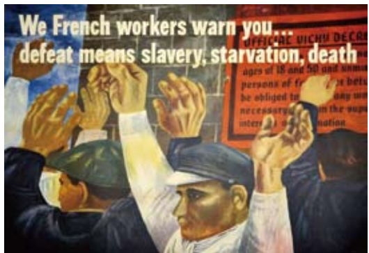
我们，法国工人，告诫你们：战败意味着奴役，饥饿和死亡……