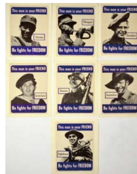
图5：他是朋友（将中国放在第一个）。