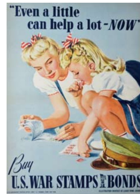
图11:小孩可以有更大贡献。

较之于其他艺术品的收藏,战争海报的藏品有诸多特点:首先,它的所有成品的展现一定是直观易懂、一目了然的;其次,设计理念是一定要第一眼就抓住观众的眼球。因此,海报很明显地,都给观众带