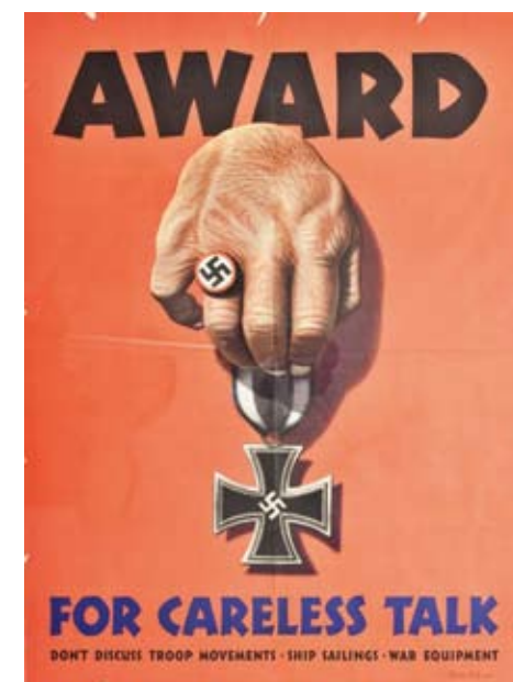
图13:勋章:由纳粹颁发给由于随便讲话造成泄密者。

来深刻的印象,进而影响到人们的心理和情感导向。设计中的很多素材就是来源于战争,透过构图(如图3)用纯文字,(图10)用黑白真人照片,(图1)强调透视,用覆盖着盟军国旗的武器等制造出了先声夺人的效果。