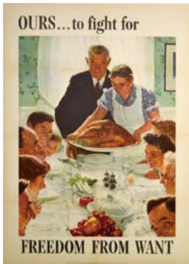
免于匮乏的自由-信仰自由。

1941年12月7日，日军偷袭美国珍珠港，太平洋战争爆发，美国正式被卷入第二次世界大战。1942年6月，美国政府成立战争情报局（Office of War Information），情报局成立的任务之一即是通过各种宣传运动来鼓舞激励美国人民团结一致，大力支持政府和军队，为这场以保卫和平和自由之战做出贡献。海报、广播、新闻短片和电影成为了当时主要的宣传手段。尤其是海报这一平面媒体，成为了当时传播力最广泛的宣传媒介。海报独具冲击力的图像配合简洁明了的宣传语，创作出一目了然的视觉效果，适合在各类公共场所张贴，如学校、医院、剧院、影院、商厦等。二战时期美国政府大力组织宣传运动的主要目的是鼓励国民资助政府和军队，团结大众为战争做出贡献，消除各种异议，节约资源能源，鼓励工厂大量生产武器等。因此在宣传海报中，经常会看到有关战争债券（war bonds），情报保密（consequence of careless talk），节约食物能源，提高民防意识，胜利回家，“女性力量”和反德日两国的题材。美国政府大批印刷宣传海报，其意义与大量生产子弹一样，这不仅是武力的战斗同时也是一场考验心灵和意志的战争，而胜利的最终关键在于人民的支持。在政府的大力推广和支持下，战争情报局招纳了当时活跃于各知名报刊杂志的插画家和艺术家来创作宣传海报，具有不同艺术风格的艺术家所创作的海报大相径庭，呈现出当时美国丰富多元的艺术风貌。