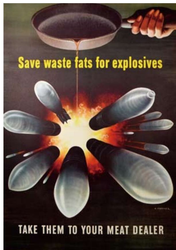
图1：节约剩油，带给供应商，集中造战争炸弹。