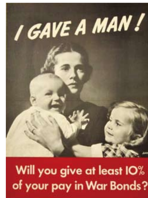
图10:我奉献了一个男人,你可以购买不低于你收入10%的战争代理券吗?

战争海报是一种特殊的艺术表现形式。可以从上面几类美国二战海报的欣赏中刊出,它在当时传播手段相对单一的战争时期起到了不可估量的作用。即使现在的人们看来也有很强的震撼宣传的效果。