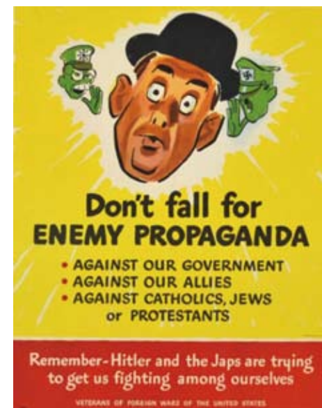
图6：不要受敌人宣传的影响。